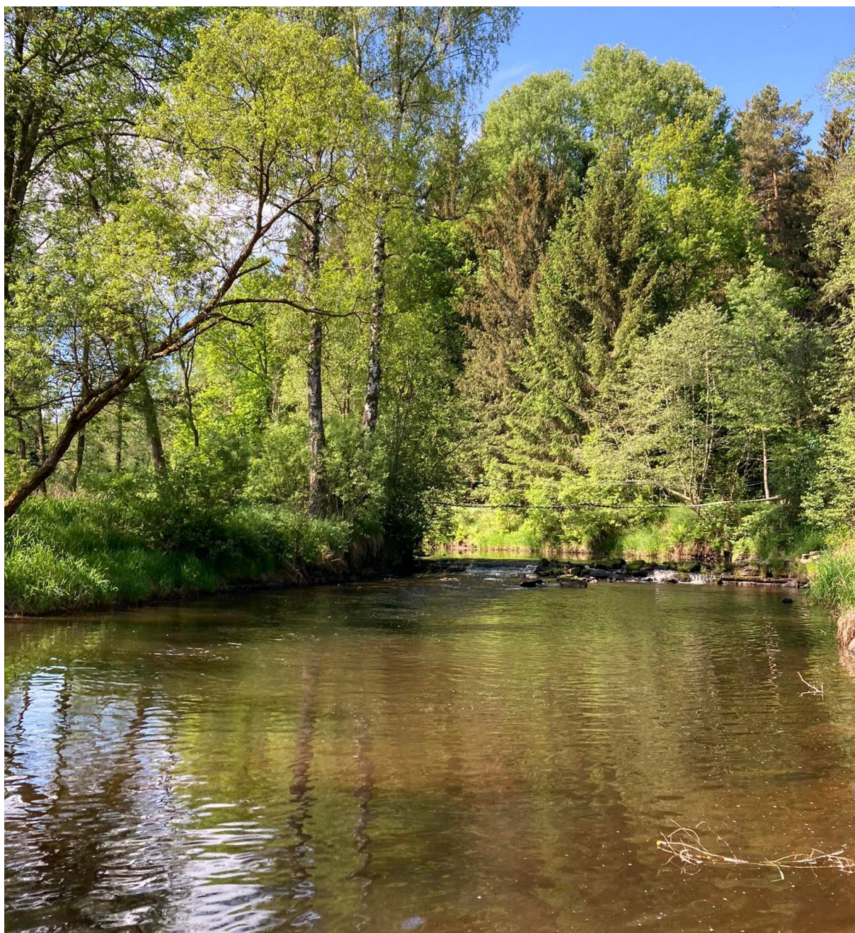
Obrázek 1: Část toku říčky Černé, kde proběhl demonstrační odlov elektrickým agregátem.