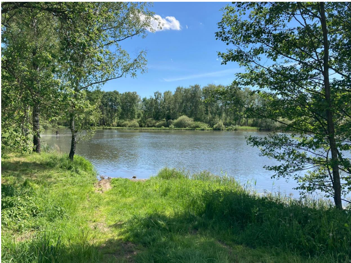
Obrázek 2: Část litorálu rybníka U Kovárny, kde proběhly demonstrační odlovy zátahovou sítí.