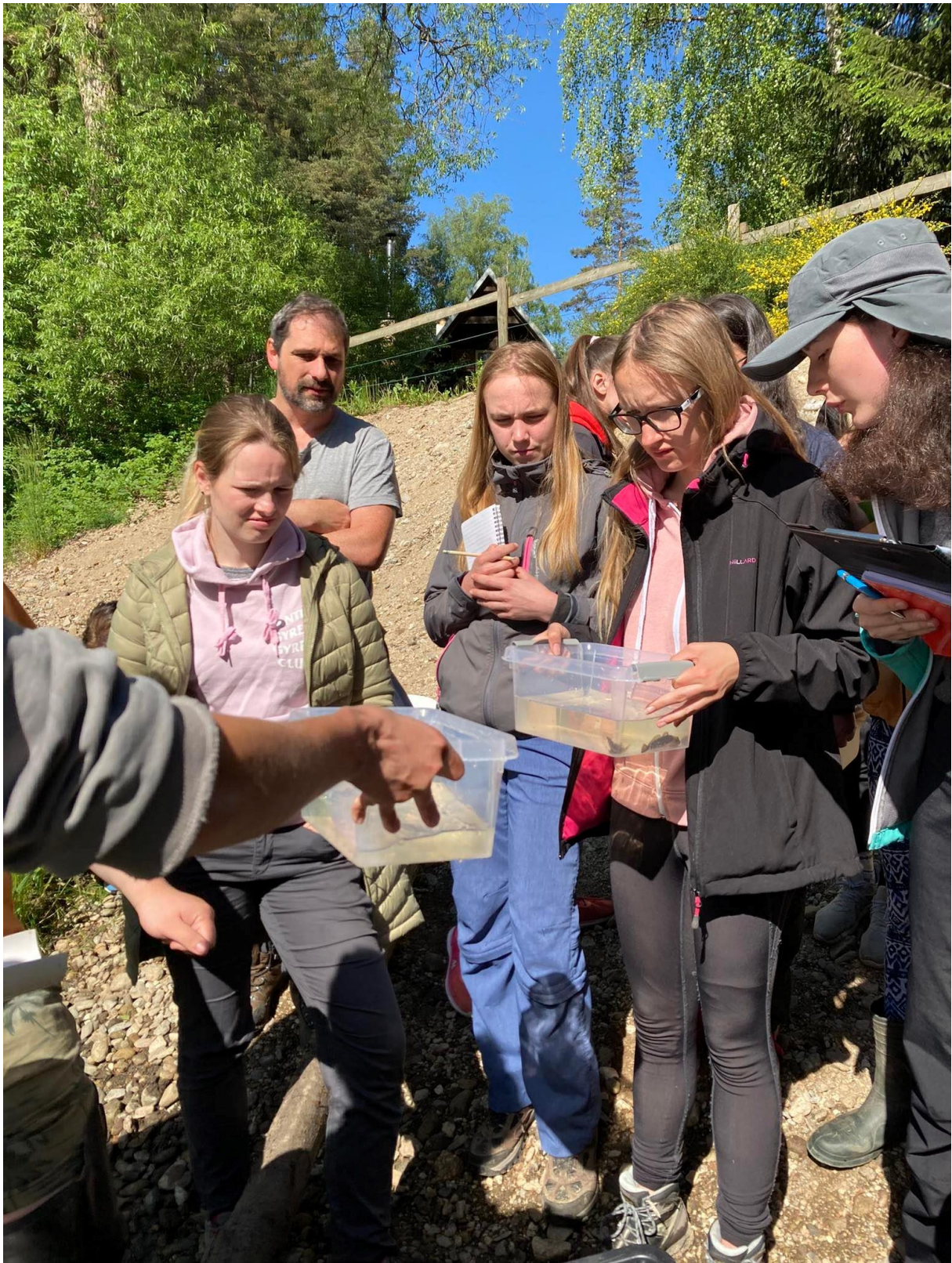
Obrázek 4: Ukázka ryb studentům v „terénních akváriích“.