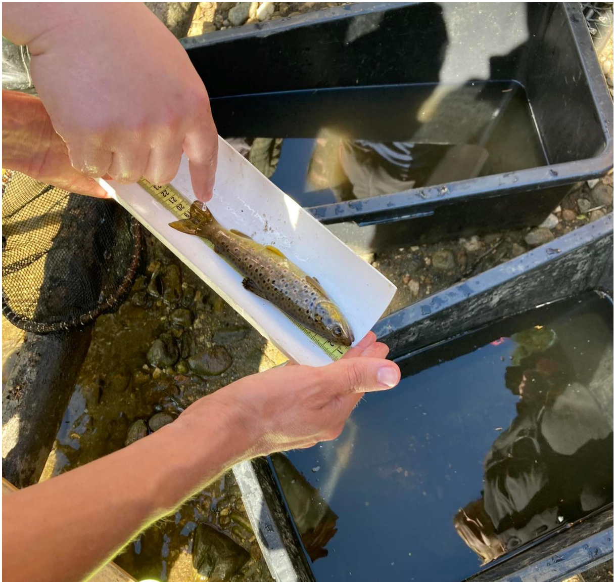
Obrázek 3: Měření uloveného pstruha obecného z říčky Černé.